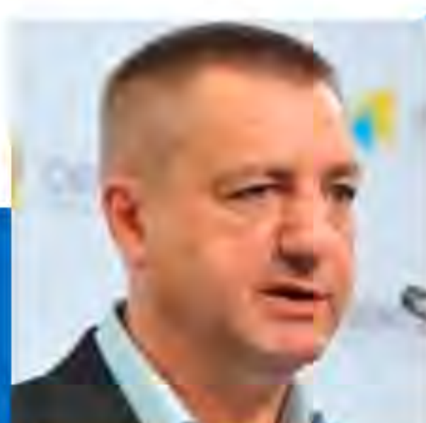
ВАДИМ КОДАЧИГОВ, Президент, Асоціація виробників озброєння та військової техніки України