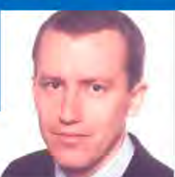
ІЛЛЯ ГАМАЛІЙ, Провідний банкір, ЄБРР