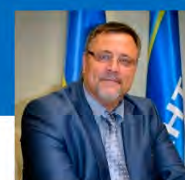
ОЛЕКСАНДР КРИВОКОНЬ, Президент, Антонов