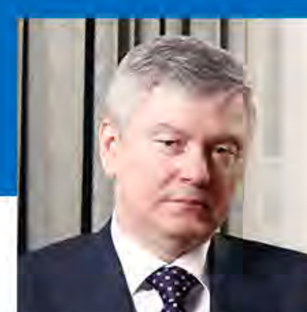
ГРИГОРІЙ ДАШУТІН, Голова, Федерація роботодавців машинобудівної промисловості