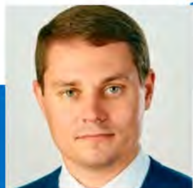
МИХАЙЛО ТІТАРЧУК, Заступник Міністра економічного розвитку і торгівлі України